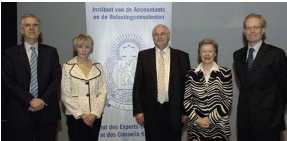
Het uitvoerend comité met de algemeen directeur

Het Instituut heeft op 10 mei 2007 eveneens meegewerkt aan de "Vlaamse Startersdag", op 8 en 9 november 2007 aan het colloquium "De toekomst van de vrije beroepen" en op 15 november 2007 aan "Overnamemarkt.be", evenals aan de rondetafel van het FVIB rond de beperking van de burgerlijke beroepsaansprakelijkheid van de vrije beroepen op 27 november 2007 en aan de beurs "Ondernemen" in maart 2008. De spreker onderstreept ten slotte dat met de vernieuwde website later dit jaar, het Instituut de communicatie wil verbeteren naar de leden en het grote publiek toe.